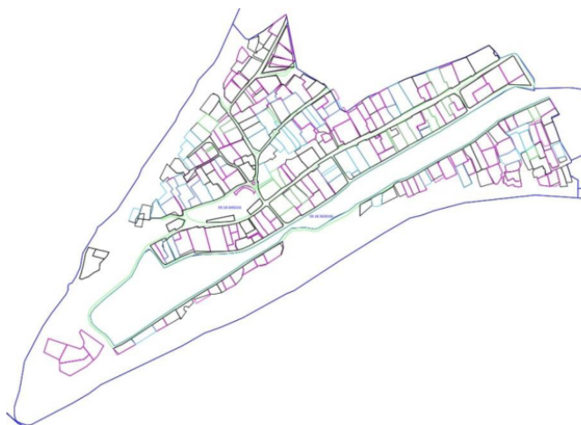
Рис.4 Местоположение утверждаемых красных линий

Проектом межевания территории предусматривается уточнение земельных участков (в том числе путем исправления реестровой ошибки). Указанная информация представлена в таблице 4, графическая часть отображена на чертеже межевания территории.