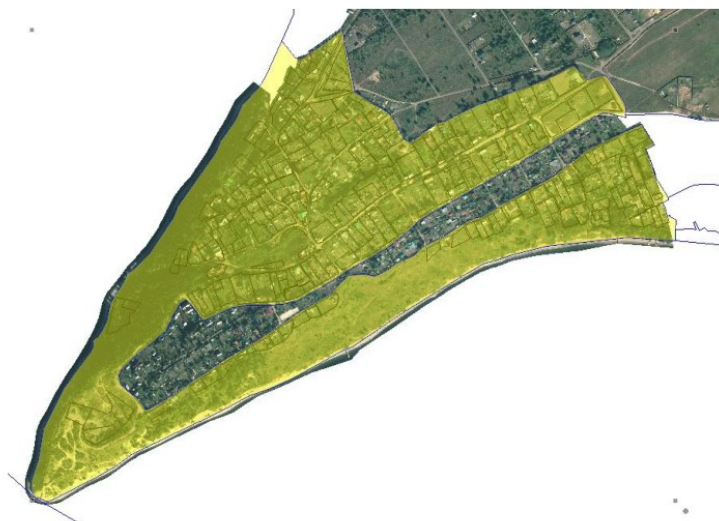
Рис. 1. Местоположение территории кадастрового квартала 59:18:0450101

Территория проектирования ограничена территорией кадастрового квартала 59:18:0450101. Местоположение территории кадастрового квартала представлено на рисунках 1, местоположение территории проектирования представлено на рисунке 2.